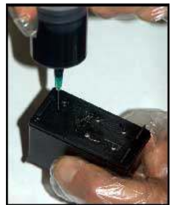
cartuccia alta capacità *339*

- Installare la cartuccia ricaricata ed effettuare un ciclo di pulizia