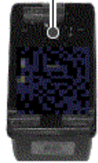
cartucce modello * *339* *